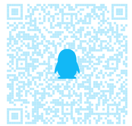
(d) QQ 支付